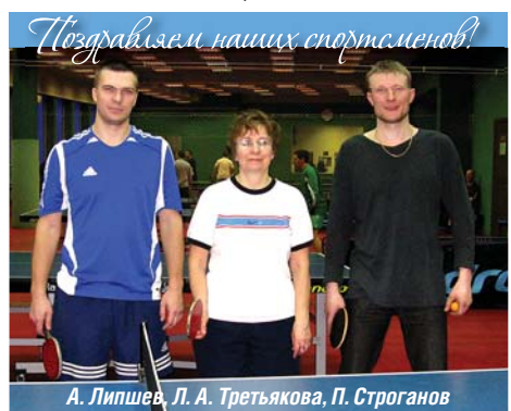
Поздравляем наших спортсменов!

В последнем соревновании по настольному теннису спортсмены «Ленсвета» набрали 28 очков, не добрав всего восемь очков, чтобы стать победителем соревнования.