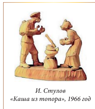
И. Стулов «Каши из топора», 1966 год

– Резьбой по дереву может заниматься любой человек, на это есть очень простой ответ: берешь дерево, вырезаешь из него все лишнее, тогда из него и получается задуманное. Дерево надо чувствовать душой и руками, тогда все получится!