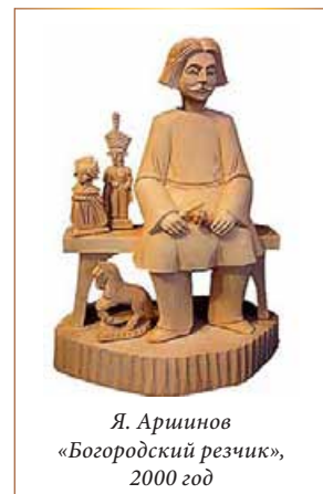
Я. Аршинов «Богородский резчик», 2000 год