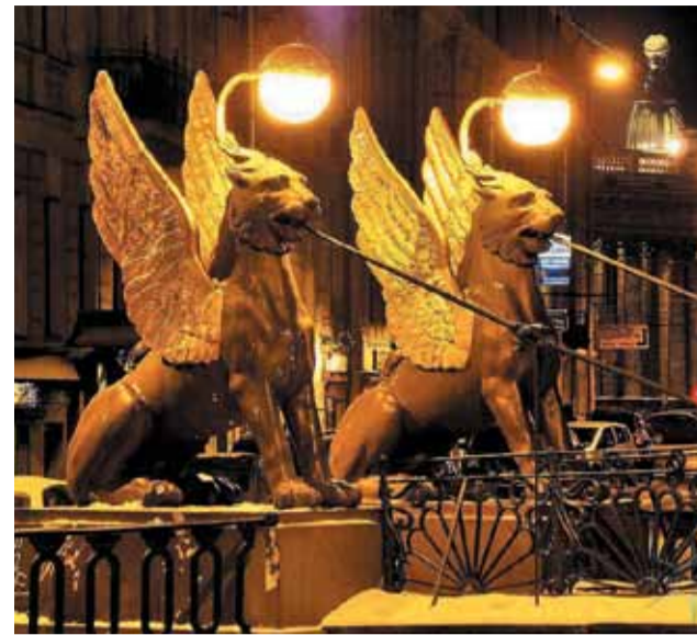
Банковский мост ночью

днило их облик. Вернулись светильники только в начале 1950-х годов, когда возрождалось художественное убранство многих старинных мостов. К сожалению, целый ряд деталей новых фонарей не соответствует особенностям осветительной техники первой половины XIX века, например, крышки стеклянных шаров сделаны полукруглыми, поэтому работу по возвращению фонарей на Банковский и Львиный мостики нельзя в полной мере считать реконструкцией (точным воссозданием по старинным чертежам и изображени-