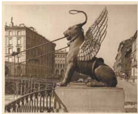
На фотографии начала XX века фонари отсутствуют, сохранились только дуги с кольцами

днило их облик. Вернулись светильники только в начале 1950-х годов, когда возрождалось художественное убранство многих старинных мостов. К сожалению, целый ряд деталей новых фонарей не соответствует особенностям осветительной техники первой половины XIX века, например, крышки стеклянных шаров сделаны полукруглыми, поэтому работу по возвращению фонарей на Банковский и Львиный мостики нельзя в полной мере считать реконструкцией (точным воссозданием по старинным чертежам и изображени-