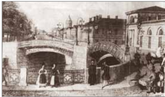
Трехарчный мост, гравюра 1834 года

Небольшие мостики, построенные разнообразными усовершенствованиями (увеличение количества рожков, применение отражателей) делали свет масляных фонарей более ярким, но усложняли работу фонарщиков, которая и без того была тяжелой, а нередко и опасной. Светильники Трехарчного моста, эффектные по своему облику, были очень не удобны в обслуживании. Подвешивать и снимать лампы, зажигать и гасить огонь приходилось внутри шарообразных стекол (снимая каждый раз крышку). Работа при этом велась высоко над водой на лестнице, прислоненной к узкой опоре. Не удивительно, что вскоре после постройки моста произошло несчастье – один из фонарщиков упал в Мойку. Конструкцию пришлось менять. Вместо стеклянных шаров в верхней части опор появились дугообразные завершения. Каждая дуга заканчивалась двумя завитками-волютами, к которым на блоках подвешивался шестигранный светильник.