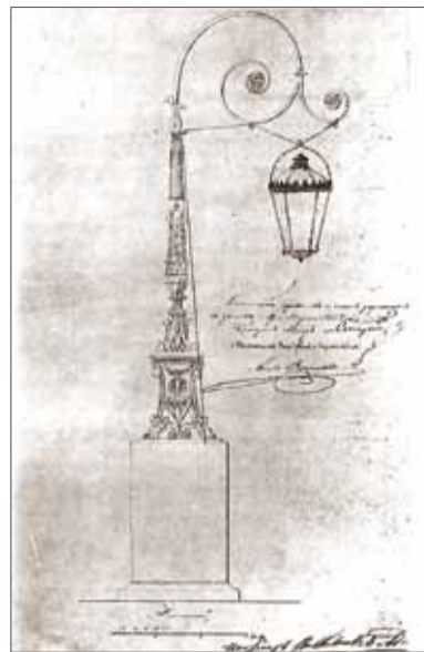
Проект фонаря для Трехарчного моста с опускающимся светильником

Фонари изменились до неузнаваемости, но изысканный рисунок волют удачно сочетался с плавными изгибами оград. Архитектурный облик моста не пострадал, а у фонарщиков появилась возможность с помощью веревки опустить светильник вниз и, открывая дверцу, выполнять необходимую работу. ■