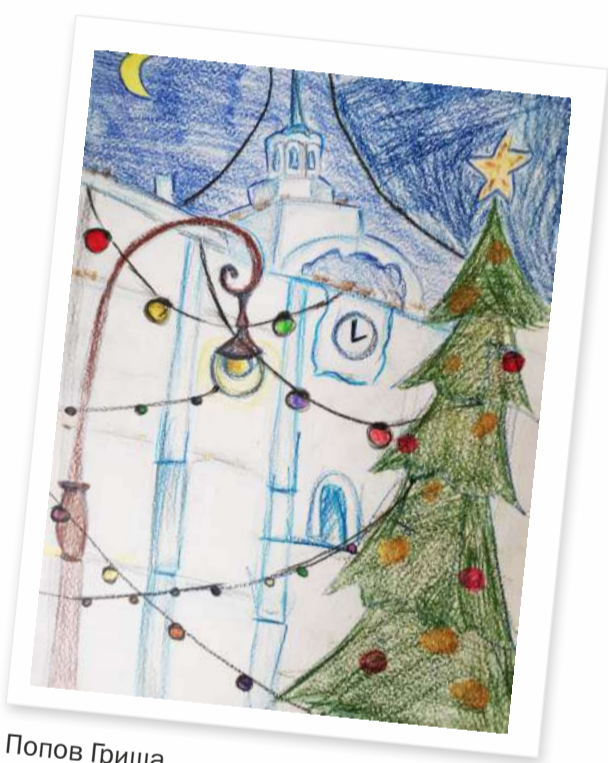
Попов Гриша, 6,5 лет