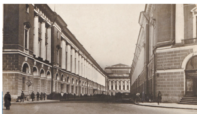
Санкт-Петербург, улица Зодчего Росси, 1934 г.

В это же время неподалеку начал свою активную деятельность трест «Ленсвет», первый официальный адрес учреждения – улица Зодчего Росси, дом № 1/3.