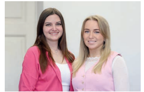
в акватории Невы как символ города Санкт-Петербурга.

— На наш взгляд, интересным проектом для закупки можно назвать проекторы с изображением Алых парусов, которые будут украшать стены Петропавловской крепости